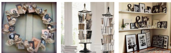
Fig.4. Exemple de fotografii ca elemente de decor.

Folosirea fotografiei ca elemente de decor – se folosesc fotografii în rame, se fac diferite compoziții din ele, se aplică la diferite obiecte de interior care creează o atmosferă și o ambianță plăcută, (Fig.4).