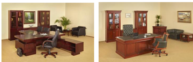
Fig.3. Exemple de fotografiere a mobilierului în spațiu special amenajat.

În timpul filmării mobilierului și interioarelor iluminarea avînd rolul principal, iluminarea naturală în cele mai dese cazuri nu este neajuns. Blițul încorporat la fel nu ne permite de a face fotografii calitative. Se analizează iluminarea și în dependentă de ea se setează balansul de alb. Diafragma se stabilește la nivel scăzut, folosind în totdeauna trepedul, căci expunerea la iluminarea naturală și a diafragmei scăzute este de obicei lungă. Fotografiile mobilierului trebuie să fie vii, trebuie să transmită factura obiectului, căldura lui, confortul. Obiectele separate, detalii și fragmente de mobilier se fotografiază în studio sau la fața locului. Lumina reglată accentuează forma, factura țesăturilor, scoate în evidență structura lemnului, (Fig.3). Fotofixare obiectelor de construcție prezintă luciul sau matul tapițeriei din piele. Fundalul se creează în timpul filmărilor sau cu ajutorul programelor grafice. Mobilierul în interioarele modelate este o soluție frumoasă și economă. Fotografierea mobilierului în interioarele reale necesită o iluminare fotografică specială, pentru a prezenta calitatea mobilierului și ascunde defectele interioarelor.