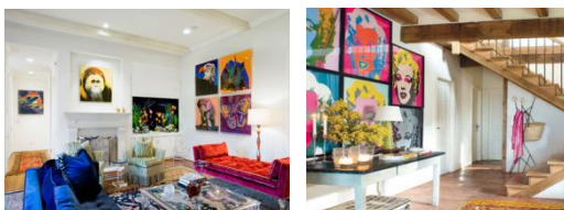
Fig.5. Exemple de fotografii ca elemente de decor în stilul Pop Art.

Fotografia ca componentă a stilului de interior - drept exemplu servește prezența fotografiei în stilul Pop Art, care reprezintă stilul emoțional și energetic, cum ar fi o explozie de emoție, Pop Art este creat pentru a surprinde oamenii cu designul său, (Fig.5).