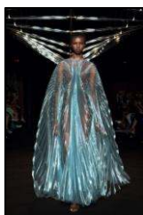
Figura 12. Produs hibrid [9].

În 20 de pași - instalarea specifică Studio Drift care însoțește colecția SYNTOPIA a designerului, este un tribut evoluției și dorinței umane finale de a putea zbura. Aripile flexibile ale sticlei delicate reprezintă etapele constructive a unui progres continuu. Pasărea de sticlă vioasă flutură în simbioză cu modelele în timp ce acestea merg pe podium, interacțiunea lor delicată accentuează fragilitatea lumilor noi care trăiesc și se ridică în zbor împreună (Figura 13).