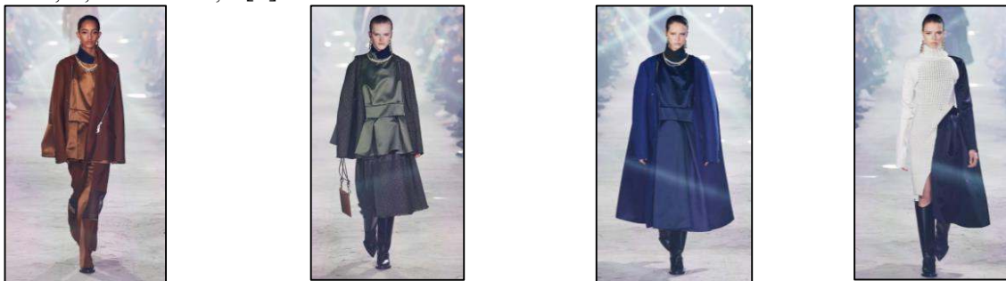
Figura 1. Produse hibride ale brandului japonez Sacai [1].

Acest fenomen este reprezentativ pentru brandul japonez Sacai care crează îmbrăcăminte de lux în frunte cu designerul Chitose Abe din anul 1999 (Figura 1), păstrându-și stilul inedit, este influent în depășirea contradicțiilor dintre îmbrăcăminte uzuală și cea formală. Abe lucrează cu diverse tipuri de țesături, punând la un loc stiluri și materiale eterogene, neținând cont de șabloane de frumusețe și contradicții [1].