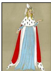
Figura 3. Pelerină, anul 1486 [3].

Acest fenomen are un viitor impunător datorită faptului că nu este specific pentru fiecare persoană, permite prezentarea persoanei ca o întruchipare a individualismului, o modă fără compromise. Până și pelerina, un produs vestimentar aparent banal, cu o istorie vastă și cu o geneză care se trage încă din epoca medievală (Figura 3), inițial având un scop funcțional, de a proteja de vânt și ploaie, erau destul de confortabile pentru călărit sau erau purtate de ofițerii bisericești și surori medicale, astăzi, aceasta își dezvoltă și schimbă rolul său inițial, fiind perfectă pentru crearea unor produse hibride (Figura 4, Figura 5) [3].