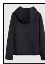
Figura 7. Produs hibrid, brandul Neil Barrett [5].