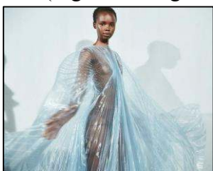
Figura 11. Produs hibrid a brandului Iris van Herpen [9].

reflecțiilor de lumină pe organza transparentă. Plisată în panouri semisferice, descoperă corpul modelului atunci când pliurile transparente se încrucișează în direcții diferite, precum aripi de sticlă în aer (Figura 11, Figura 12) [9].