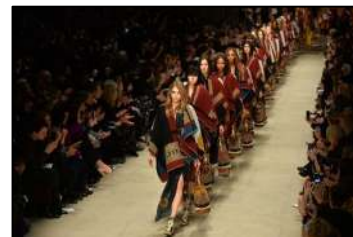
Figura 5. Pelerine, brandul Burberry 2014 [3].

Moda hibridă nu a ocolit cu vederea acest produs, astfel că mulți designeri renumiți modifică și reconstruiesc acest produs într-o variantă modernă (Figura 6) [4].