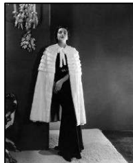
Figura 4. Pelerină, anul 1932 [3].