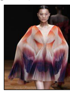
Figura 13. Rochii-pelerină brandul Iris van Harpen [9].