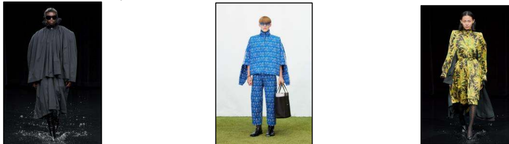
Figura 8. Produse hibride ale Casei de Modă Balenciaga sezonul 2020-2021 [6].

Moda hibridă a cucerit brandurile internaționale prin libera posibilitate de experimentare, fără limite și retușuri, adesea cu un simț avangardist bine deslușit, cu creații care pun în evidență probleme internaționale și oferă posibilitatea de liberă exprimare, fără discriminări și rasism. Casa de modă Balenciaga este cea care în colecțiile sale este influențată de moda hibridă, lasându-și gândurile și emoțiile să creeze arta, o imperfecțiune perfectă. Casa de modă stilizează astfel pelerina încât aceasta este nedeslușibilă, creând un produs hibrid unde rolul pelerinei îl are mânecile, care nu sunt funcționale (Figura 8) [6].