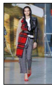
Figura 2. Produse hibride ale brandului Unravel Project [2].

Acest fenomen are un viitor impunător datorită faptului că nu este specific pentru fiecare persoană, permite prezentarea persoanei ca o întruchipare a individualismului, o modă fără compromise. Până și pelerina, un produs vestimentar aparent banal, cu o istorie vastă și cu o geneză care se trage încă din epoca medievală (Figura 3), inițial având un scop funcțional, de a proteja de vânt și ploaie, erau destul de confortabile pentru călărit sau erau purtate de ofițerii bisericești și surori medicale, astăzi, aceasta își dezvoltă și schimbă rolul său inițial, fiind perfectă pentru crearea unor produse hibride (Figura 4, Figura 5) [3].