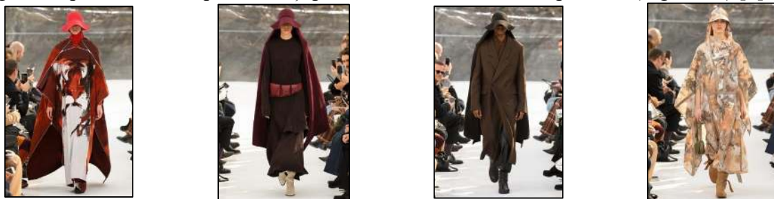
Figura 10. Produse hibride brandul Kenzo [8].

Un alt brand cu rădăcini nipone este brandul Kenzo în frunte cu designerul Kenzo Takada care prezintă o colecție în stil nomad, pelerina având un rol esențial, aceasta este prezentată ca un tot întreg cu acoperământ de cap sau însuși pălăria fiind comasată cu o pelerină (Figura 10) [8].