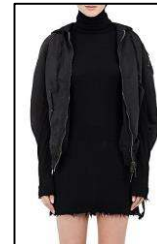
Figura 6. Produs hibrid, brandul Unravel Product [4].

Brandul Neil Barrett arată că produsul pelerină poate fi comasat cu diverse produse până și cu un hanorac. Un produs cu linii bine definite glugă, unește stilul elegant cu cel sportiv (Figura 7) [5].