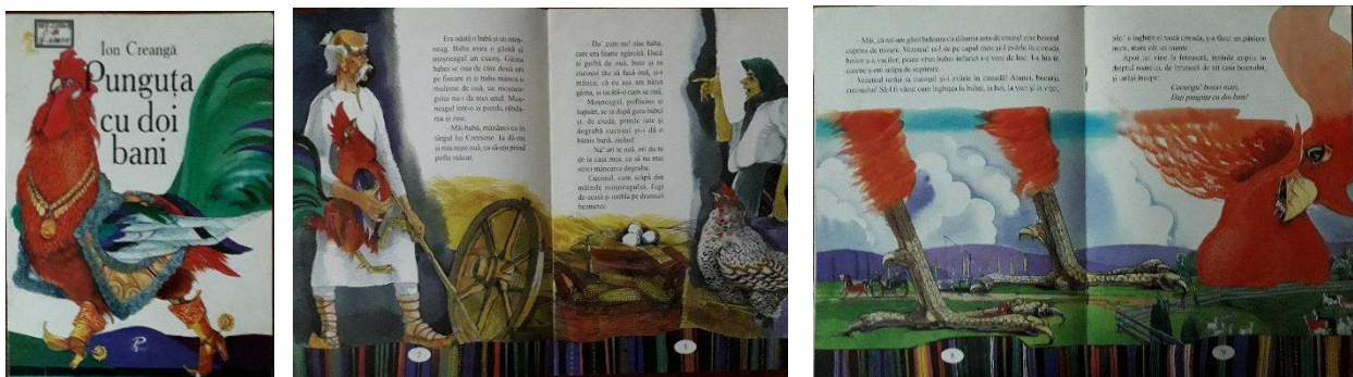
Figura 2. Ilustrații din ediția „Punguța cu doi bani” (coperta, pagini din interior) de Ion Creangă, grafica de carte-Alexei Colîbneac [4]

Coperta (figura 2) ilustrează naratorul poveștii – Cucoșul , într-o manieră sofisticată, imagine care rămâne perceptibilă și în amintirea adulților, ilustrația este dinamică, simetrică, unică ca stilistică și reprezentare. Imaginea de ansamblu este realizată în acuarelă, cu elemente de tuș-peniță pentru reprezentarea detaliată a ornamentelor și decorului de pe vestimentația personajului.