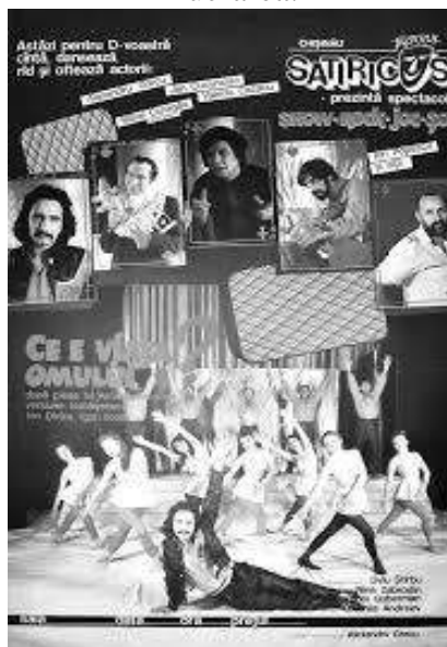
Figura 3. Afișul spectacolului „Ce e viața omului” de A. Arkanov. Teatrul „Satiricus I.L. Caragiale”, anii '90, sec. XX

În afișul teatral (figura 3) se recurge la un truc vizual de includere a spectatorului în spectacol prin aducerea scenei în prim plan și inducând spectatorul în ambianța teatrală inedită. Artiștii sunt mai aproape și ei prin imaginile ce îi reprezintă. Elementele textuale se constituie în casete imaginare ce vin să completeze afișul, dar sunt subordonate elementelor grafice. Compoziția structural este una de tip deschisă, lipsesc câmpurile, iar ritmul, verticalele și oblicele sunt mijloacele de expresie ce dinamizează lucrarea.