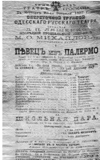
Figura 1. Afiș. Opera „Cântărețul din Palermo”, libret de B. Buhbinder. Turneul trupei de operetă a Teatrului Rus din Odesa la Teatrul „V. Grosman” din Chișinău, 1897