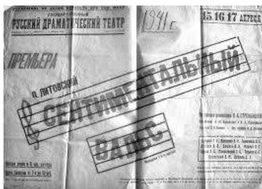
Figura 2. Afișul spectacolului „Valsul sentimental” de O. Litovski, Teatrul Dramatic Rus din Chișinău, 1941

În afișul teatral (figura 3) se recurge la un truc vizual de includere a spectatorului în spectacol prin aducerea scenei în prim plan și inducând spectatorul în ambianța teatrală inedită. Artiștii sunt mai aproape și ei prin imaginile ce îi reprezintă. Elementele textuale se constituie în casete imaginare ce vin să completeze afișul, dar sunt subordonate elementelor grafice. Compoziția structural este una de tip deschisă, lipsesc câmpurile, iar ritmul, verticalele și oblicele sunt mijloacele de expresie ce dinamizează lucrarea.