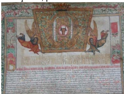
Fig. 8. 1763(7272) oct. 15, Iași. Hrisov prin care Grigore vv. Calimach, desființează pogonăritul și vădrăritul.