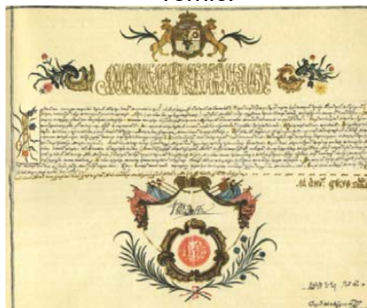
Fig. 7. 1799 dec. 1, Iași. Constantin Alexandru vv. Ipsilanti confirmă privilegiile M-rii "Sf. Spiridon" din Iași, pentru spital.