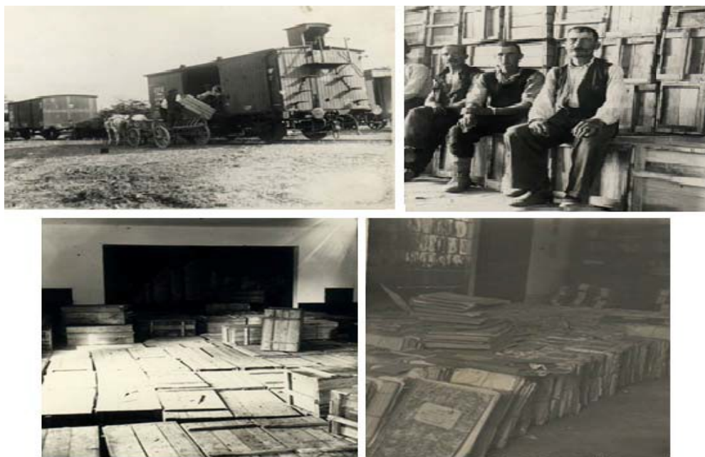
Fig. 1. Imagini din perioada refugiului Arhivelor Statului din Iași la Săcelu (jud. Gorj), în anul 1944.

Învățământului Public sub autoritatea Ministerului de Interne 6 , cu noi atribuții și norme de funcționare 7 , schimbate apoi de Legea nr. 20/1972 și mai apoi, de cea valabilă și astăzi, Legea nr. 16/1 aprilie 1966 (determinată de schimbările din structurile instituționale de după anul 1989), modificată și completată în anii 2002, 2006, 2009, 2013, ce presupune Integrarea practicii arhivistice românești în cadrul general al practicii arhivistice din UE.