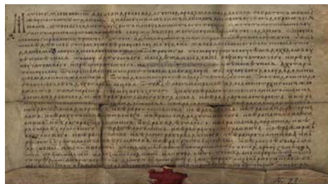
Fig. 3. 1411(6920) sept. 22, Suceava. Hrisov de la Alexandru vv. <cel Bun>, domn al Moldovei