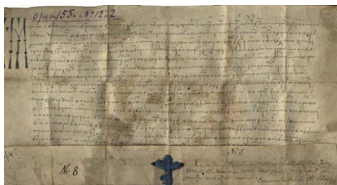
Fig. 4. 1458 (6966) aug. 31, <Târgul de Jos> Hrisovul lui Ștefan vv. <cel Mare> pentru Mănăstirea Moldovița.