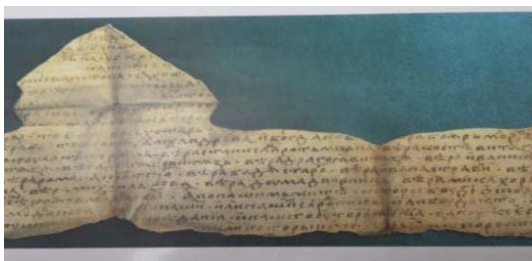
Fig. 2. Fotografie după original slav, pergament, fragment rupt în trei, se păstrează numai partea din mijloc (14x24 cm).