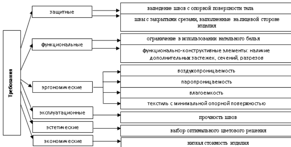
Рисунок 2: Наиболее значимые требования к больничной одежде пациентов и вероятные способы их решения

Обеспечение комфорта одежды для пациентов возможно следующими средствами: