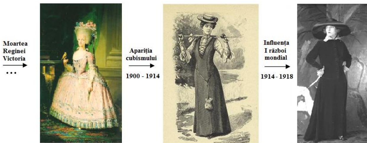
Figura 1. Evoluția rochiei pînă la I război mondial

Anul 1901 este marcat de moartea Reginei Victoria și sfârșitul unei epoci, în care se observă dezacordul între clasele sociale, unde regulile vestimentare erau unele stricte, ținutele având o gamă limitată de culori, fiind adaptate statutului social și vârstei – figura 1.