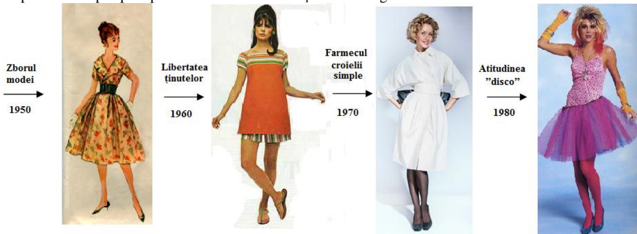
Figura 3. Rochia anilor '50 - '80 – stilul propriu de viață al femeii

După al II-lea război mondial, moda debutează printr-o explozie de feminitate și gingășie. Femeia are dreptul de a-și crea propriu stil, de a-și putea exprima personalitatea prin haine. Rochia este vedeta indiscutabilă a acestor ani, fiind de lungime medie, sub genunchi, de formă conică sau evazată. Accentul cel mai puternic era pus pe aspectul exterior armonios și estetic – figura 3.