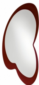
Oglindă cu ramă din MDF

Despre un decor din oglindă nu se poate spune că este prea aglomerat, prea colorat sau prea întunecat. Cert este că, acolo unde este amplasată, creează numai avantaje din punct de vedere estetic și funcțional.