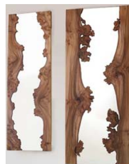
Oglinda cu ramă din lemn natural