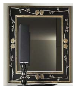
Oglindă cu ramă din marmoră și bronz