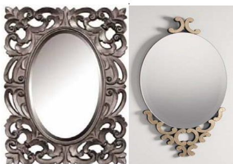
Oglinzi cu ramă din argint și platină