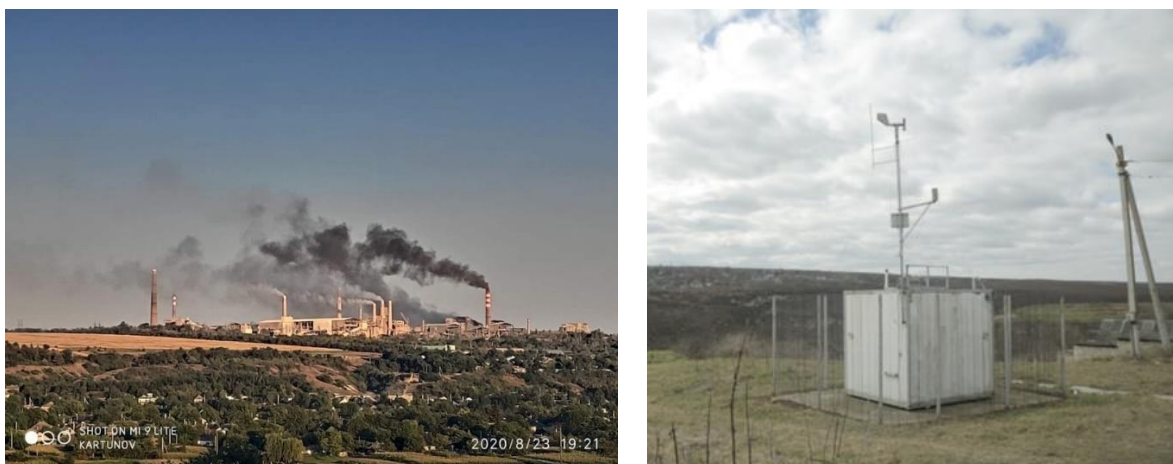
Figura 2. Uzina metalurgică și uzina de ciment din Râbnîța și stația instalată în localitatea Mateuți din raionul Rezina.

Contribuie la poluarea mediului și fabricile de cărămidă din Tiraspol (care nu are autorizație de mediu, emisă de Agenția de Mediu a Republicii Moldova) și din satul Chirca, raionul Anenii Noi, având cele mai mari emisii CO 2 de 11,5 kt, în a. 2021 (a se vedea Tabelul 1).