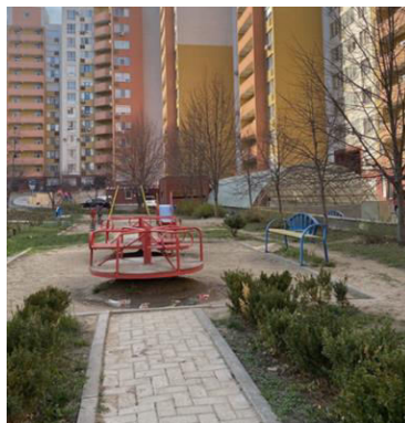
Fig. 4. Zone verzi, str. Grenoble, Botanica

Zone verzi și naturale: Integrarea zonelor verzi și a elementelor naturale, precum arbori, plante și vegetație, nu doar îmbunătățește estetica spațiului, dar oferă și un mediu mai sănătos și mai relaxant pentru joacă și explorare.