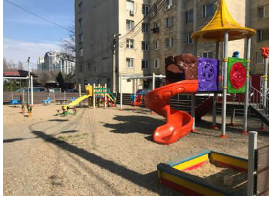
Fig. 9. Spațiu de joacă nou, sec. Râșcani