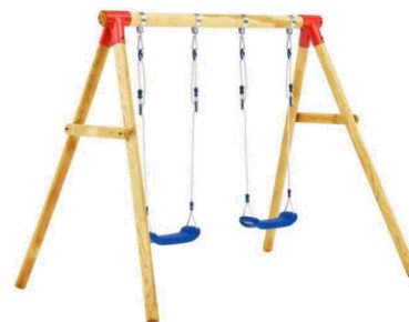
Fig. 3. Leagăne [3]

Suprafețe sigure și amortizante: Solul din jurul echipamentelor de joacă trebuie să fie acoperit cu materiale care să ofere amortizare în caz de căzături, cum ar fi cauciucul granulat, nisipul sau plăcile speciale de siguranță.