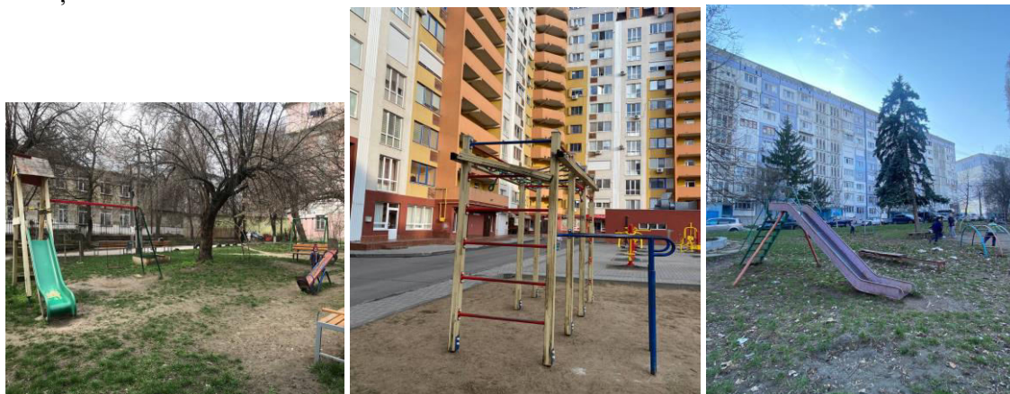
Fig. 6. Bd. Grigore Vieru 21, Fig. 7. Str. Grenoble, bloc nou, Fig. 8. Bd. Cuza Vodă 42 bloc vechi nerenovat din 2009

Păreră negativă este influențată de starea învechită a structurilor de joacă, precum și deteriorarea lor. De asemenea, lipsesc echipamente pentru copii cu vârsta până la 5 ani și cu dizabilități.