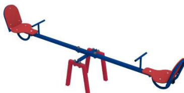
Fig. 2. Balansoare [2]