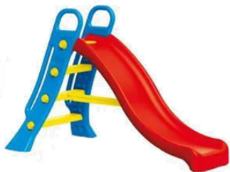
Fig. 1. Tobogane [1]

Structuri de joacă variate și adaptate: Tobogane, leagăne, cățărători, balansoare și alte echipamente de joacă, proiectate pentru a stimula diverse abilități motorii .