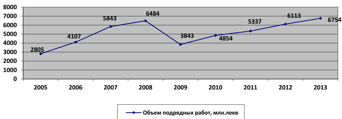
Рис. 1. Объем подрядных работ, выполненных строительными организациями РМ, млн. леев

Начиная с 2005 года, в республике наблюдалась тенденция бурного роста объема выполненных подрядных работ (рисунок 1).