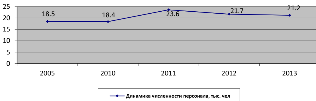
Рис.4. Динамика численности персонала строительной отрасли

Наряду с ростом количества строительных организаций в рассматриваемом периоде увеличилась и среднесписочная численность персонала.