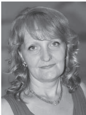
doctorandă, Universitatea Tehnică a Moldovei