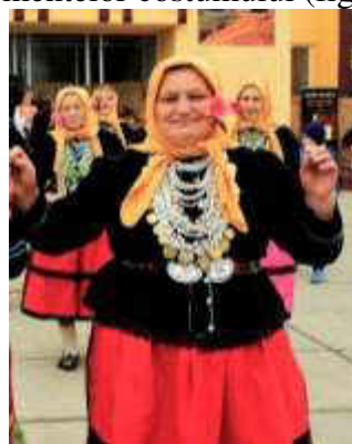
Fig. 5. Elemente ale costumului tradițional găgăuz [7]

Un alt element estetic definitoriu îl reprezintă cromatică. Din aspectul cromaticii cămașele pentru femei și bărbați românești erau realizate din pânze de casă din cânepă, in, lână, mult mai târziu din bumbac, borangic albite, fiind de nuanțe apropiate de alb. Foarte variate cromatic sunt soluțiile cromatice ornamentale reproduse prin coasere sau țesere pe cămașe, obținute din diverse surse din mediul înconjurător. Fotele și catrințele prezintă soluții cromatice închise.