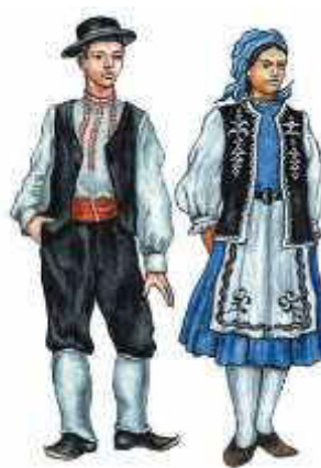
Fig. 3. Costumul tradițional găgăuz [4]

Impactul vizual al costumului asupra percepției este determinat și de divizările constructive remarcate în piesele costumului. Analizând constituirea structural-compozițională a costumului tradițional românesc pentru femei compus din: cămașă , fotă/catrință , brâu și bondiță (fig. 2.), s-a remarcat structurarea prin divizarea predominantă pe direcție verticală în cămașele pentru femei, susținută de elementele ornamentale sub formă de dungi obținute prin țesere în catrință-direcționate predominant tot pe verticală. În costumul tradițional găgăuz pentru femei (fig. 3) compus [7-9] din: toplulu fistan (rochie în pliuri mici), skladkali fista (rochie în pliuri mari), toplulufista (fustă încrețită pe linia taliei), tantelili fusta (fustă decorată cu dantele croșetate), kofta (haină cu sprijin pe umeri), hastarli kofta (haină cu sprijin pe umeri pe căptușeală), fita (șorț), jiletka (vestă), keptar (bondiță-rom.), cumușli kușak (brâu, cingătoare), çorap , divizările constructive prin secționări cele mai multe sunt direcționate pe orizontală.