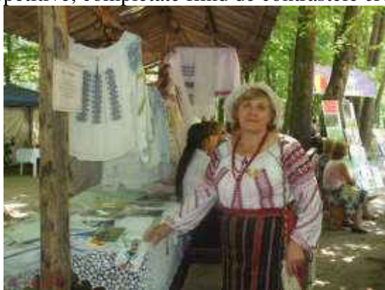
Fig. 4. Elemente ale costumului tradițional românesc [5]

Din cele remarcate, după piesele costumului tradițional găgăuz pentru femei identificate în Muzeul din Comrat, pensiunea turistică Găgăuz Sofrasi, după analiza surselor bibliografice și arhivelor documentare fotografice, ornamentarea prin tehnicile de coasere, țesere nu poartă un caracter prolific, lipsește aproape în totalitate. Accentele sunt determinate de ansamblurile podoabelor generoase-apanaje ale costumului găgăuz pentru femei, dispuse în multiple șiruri repetitive, completate fiind de contrastele cromatice ale elementelor costumului (fig. 5).