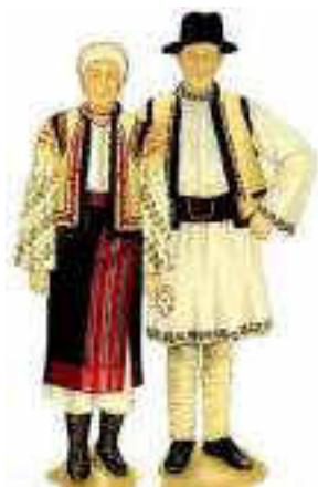
Fig. 2. Costum tradițional românesc [4]

Constituirea structural-spațială a costumului găgăuz pentru femei (fig. 2) este determinată de soluții care permit ajustarea pe purtător utilizând în acest sens proiectarea și realizarea penselor-strategie constructivă specifică datată ca apariție după unele surse bibliografice [6] cu sec. XIX, anii 1840-1890, secționarea pe linia taliei a părții superioare a produsului de cea inferioară. Suport în conextul bunei ajustări a produsului pe purtătoare este asigurat de către fita – șorțul din față și cumușli kușak -brâu.