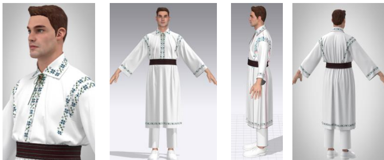
Figura 2: Cămașa de mire: forma, broderie și linii de coasere, prototip din Muzeul de Istorie și Etnografie din Leova, prezentare pe manechin digital de mărimea (182-96-96-41). Simulare clo 3d - [realizată de autori]

din două foi. Rolul de pavă de sub braț este realizat de clinii laterali ai pieptului și spatelui, lățimea cărora este de jumătate de foaie de material sau 22,50 cm. Cămașa este lungă până de după genunchi. Lungimea mânicilor nu acoperă încheietura mâinii. Gulerul este drept, dar se aranjează răsfrânt și se leagă în față cu „baiere” de culoarea broderiei.