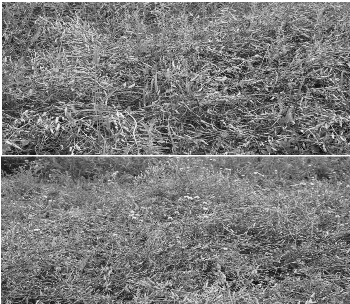
Рисунок 1. Высотное доминирование в агроценозе редьки масличной щетинника сизого ( Setaria glauca L.), мари белой ( Chenopodium album L.) (верхняя позиция, 2016 г.) и бодяка полевого ( Cirsium arvense L.) (нижняя позиция, 2018 г.) на фазу бурого стручка (ВВСН 83-86) в варианте 1,5 млн, широкорядный на фоне N_{90}P_{90}K_{90}

разработки адаптивных технологических стратегий выращивания культуры в условиях Правобережной Лесостепи Украины (Цицюра, Я. 2018), показывает высокую вероятность полегания при норме высева больше 2,0-2,5 млн шт./га всхожих семян на фоне полного удобрения 60 и выше кг/га действующего вещества. Из этого следует большая степень вероятности изменения высотного доминирования сорняков и общее увеличение их численности вследствие снижения конкурентоспособности растений.