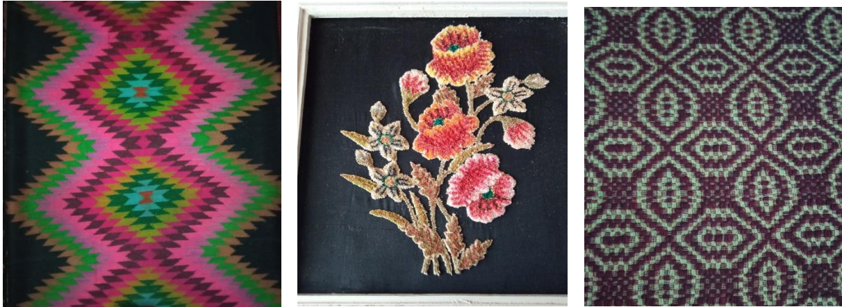
Figura 3. Lucrări ale patrimoniului etnografic