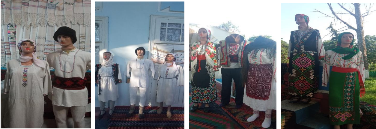
Figura 2 Expoziție de costume populare