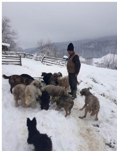
Fig. 3. Baciul moldovean cu câinii săi „mai bărbați”.

Recitind Miorița fără nicio prejudecată, TREBUIE să observăm mai întâi că lipsește fapta încriminată - omorârea propriu-zisă a baciului Moldovean, apoi descoperim că și intenția celor doi baci, ungurean și vrâncean, lipsește, întrucât naratorul nu poate depune mărturie, el spunând „ vor să mi-l omoare ”, nu îl omoară, sau îl vor omorî. Acesta este doar un povestitor ca mulți alții, iar mioara nici atât, nefiind