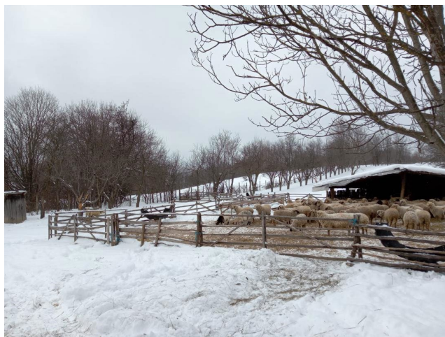
Fig. 2. Stână de ori.

Așa că, totuși „ de-a fi să mor ” mai devreme, gândește ciobanul și el să „ își vadă de suflet ”. Și face și el un testament, conform tradiției. Avere nu are, că e tânăr, a plecat la ciobănie „ de îndată ce a învățat cum să lege nojițele la opinci ” ( Simion Mehedinți - Pribeagul) ca să-și facă boteiul lui