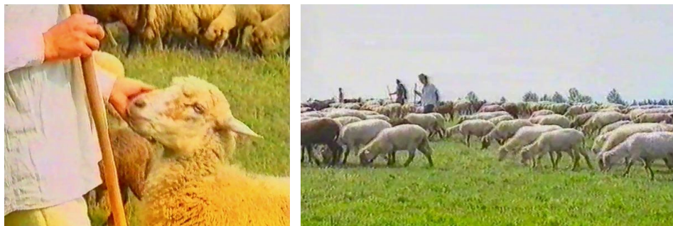
Fig. 4. Mioriță lae, lae-bucălae...

Și ca un omagiu etern, dincolo de faptele noastre de muncă, cu sprijin financiar al unui OM ce prețuiește vatra, satul, istoria, străbunii, a ridicat fundația, la SOVEJA, pe dealul dintre sate, MONUMENTUL EROILOR SOVEJENI de dintotdeauna. Acolo „sus pe deal, e-o cruce. -n nori poartă satu-n subsuori”. Și scrie pe ea: „Înfrânt nu ești atunci când