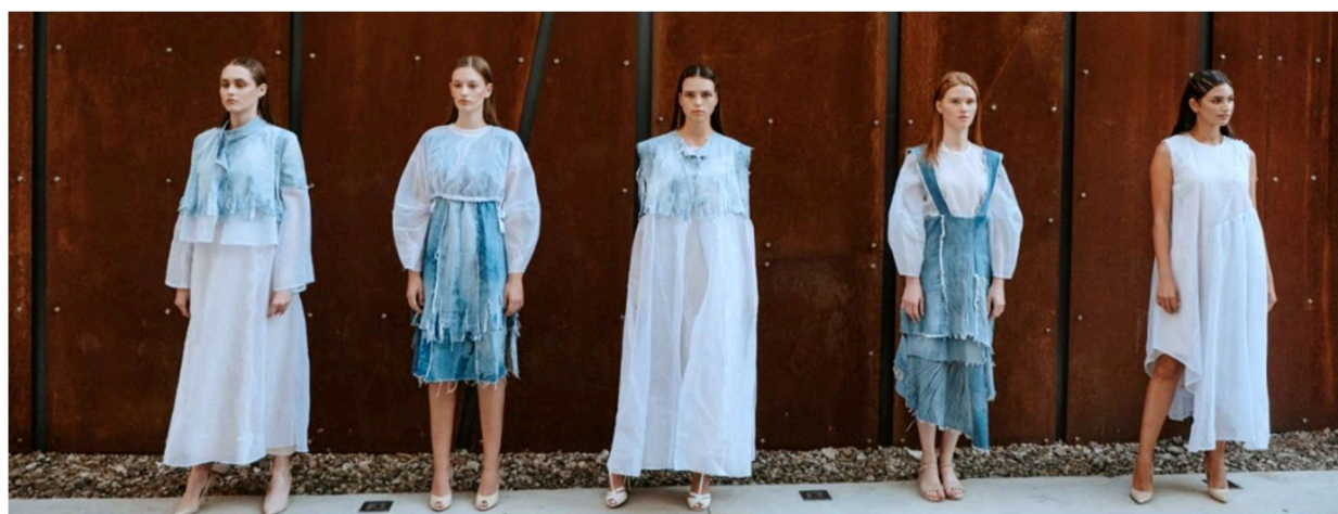
Figura 3. Colecția elaborată în cadrul proiectului de licență [9]

Colecția elaborată este determinată de contrastul suprafețelor opace – denimul cu cele transparente – combinarea-organza cu tricot. Suprapunerea acestora ne conferă o imagine optică compusă (prin organza se prevede denimul), Fig.3.