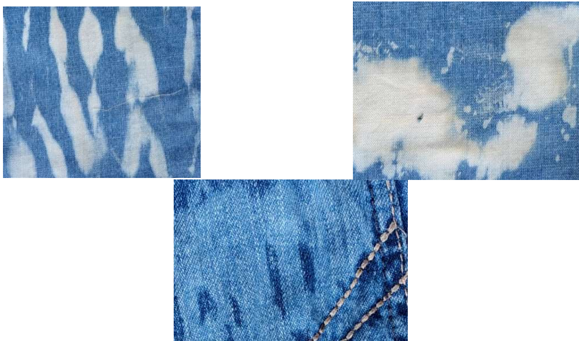
Figura 1. Decolorarea denimului în urma dezinfectării

Spălarea și dezinfectarea denimului – o fază importantă, în condițiile colectării blugilor la mână a doua. S-a propus folosirea soluției de clor pentru spălarea și dezinfectarea produselor. La folosirea clorului, au fost obținute efecte vizuale inedite, devenind parte cu importanță majoră al aspectului estetic și unic în colecția descrisă, Fig. 1.