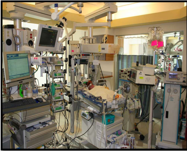
Fig.1 Sectia de Terapie Intensiva