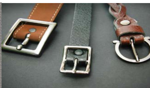
Figura 3. Cataramă străveche [7]