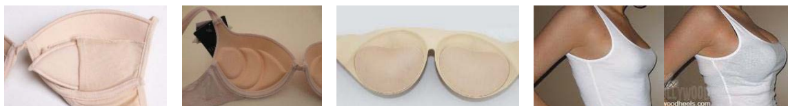
Fig. 10 Sutien cu inserții

c) Lenjeria cu inserții pentru șolduri (fig. 12) – oferă corpului o siluetă creată din linii curbe line, accentuând zona șoldurilor. Tipul dat de lenjerie nu este recomandat în cazul mărimilor mari sau a existenței șoldurilor proeminente, accentuând astfel zonele problematice. Inserțiile de completează această piesa pot fi de asemenea detașabile, oferind o varietate de dimensiuni și grosimi potrivite individual pentru fiecare tip de silueta.