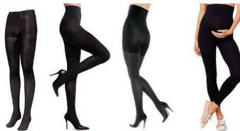
Fig. 6 Colanți compressivi

e) Lenjeria compressivă pentru coapse (fig. 5) – creată din material de micro-fibră, are o construcție dublu-strat în zona abdominală, oferind un efect estetic de linii curbe line în zona abdomenului și a șoldurilor. Această piesă acoperă zona de la talie până la mijloc sau sfârșit de coapsă, repartizând uniform țesutul adipos din zona șoldurilor pe toată această suprafață. Un punct slab asociat cu acest tip de lenjerie este crearea efectului de „vârf de brișă” care constă în deplasarea volumelor de grăsime mai sus de linia superioară a produsului și coborârea lor peste produs, creând un efect estetic negativ. Acest efect devine mai pronunțat odată cu creșterea mărimilor corporale și a volumelor în zona abdominală.