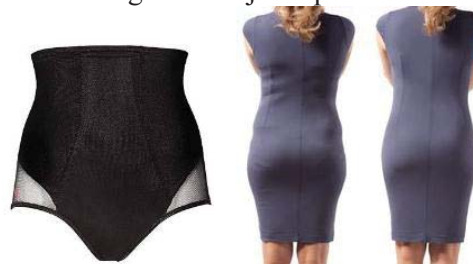
Fig. 4 Lenjerie compressivă pentru șolduri

c) Lenjeria compressivă cu suport pentru bust (fig. 3) – combină corsajul compressiv cu un sutien creat special pentru a oferi suport zonei bustului. Această piesă vestimentară este creată având un decolteu adânc și inserții de silicon „non-alunecare”, fapt ce permite utilizarea ei în ținutele de seară, care adesea necesită un decolteu adâncit. În același timp această piesă modelează zona taliei fără a apărea riscul răsucirii sau îndoirii a marginilor superioare sau inferioare care poate fi uneori observat în cazul corsetului compressiv.