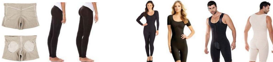
Fig. 8 Lenjerie pentru susținerea fesieră