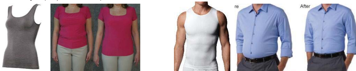
Fig. 7 Maiou compresiv pentru femei și bărbați

i) Lenjeria compresivă completă (fig. 9) – prezintă un singur produs multifuncțional care modelează corpul și membrele. Acest produs este elaborat și pentru bărbați, respectând particularitățile corpului masculin, oferind sprijin în zona toracică, abdominală și coapse. Acoperind o mare parte a corpului purtarea acestuia trebuie executată cu precauție, considerând posibilele efecte negative asupra sănătății, mai ales cele ce țin de sistemele de respirație și de circulație.