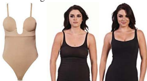
Fig. 3 Lenjerie cu suport pentru bust