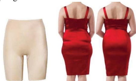
Fig. 5 Lenjerie compressivă pentru coapse

d) Lenjeria compressivă pentru șolduri (fig. 4) – este o piesă vestimentară construită din detalii centrale și laterale de compresie diferită, care modelează zona șoldurilor, extinzându-se până mai sus de talie. Astfel de produse sunt adesea înzestrate cu un elastic ce previne răsucirea acestora. Efectul vizual care se obține în urma utilizării acestei piese de lenjerie constă în modelarea exterioară a liniilor siluetei în zona taliei și a șoldurilor, precum și îngustarea acestor zone.