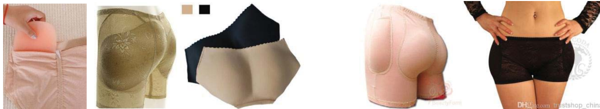
Fig. 11 Lenjerie cu inserții fesiere

c) Lenjeria cu inserții pentru șolduri (fig. 12) – oferă corpului o siluetă creată din linii curbe line, accentuând zona șoldurilor. Tipul dat de lenjerie nu este recomandat în cazul mărimilor mari sau a existenței șoldurilor proeminente, accentuând astfel zonele problematice. Inserțiile de completează această piesa pot fi de asemenea detașabile, oferind o varietate de dimensiuni și grosimi potrivite individual pentru fiecare tip de silueta.