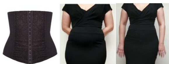
Fig. 2 Corsaj compressiv