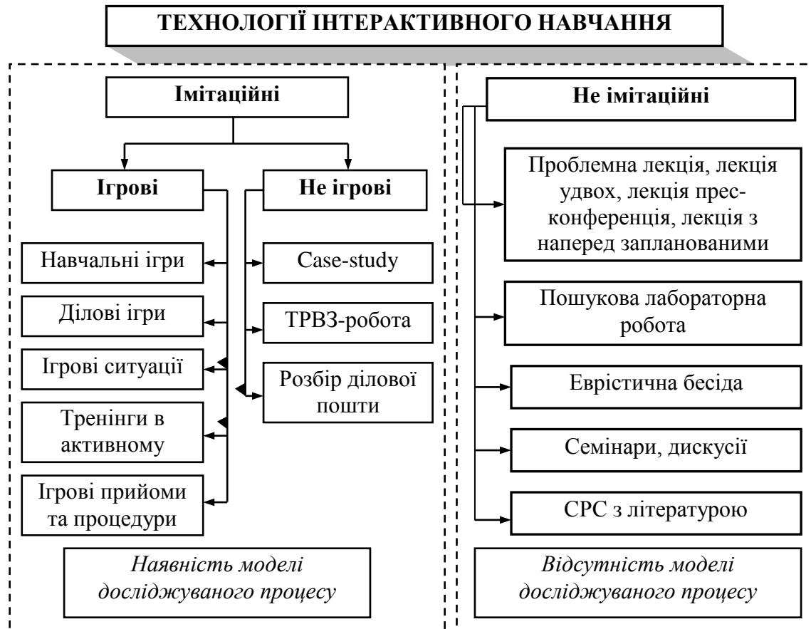
Рис. 2 Класифікація методів інтерактивного навчання

Для вирішення виховних і навчальних завдань викладачем можуть бути використані різні інтерактивні методи (рис. 2.) Згідно розробленій схемі, всі технології інтерактивного навчання діляться на неімітаційні та імітаційні . Неімітаційні технології не передбачають побудову моделей явища і діяльності, що вивчається.