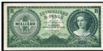
Fig.2. 1 miliard de trilioane ( 10^{21} ) pengö în 1946 la sfârșitul hiperinflației în Ungaria, bancnotă cu cea mai mare valoare nominală emisă vreodată în lume.

Inițial, adopengö a fost egal cu pengö, dar a fost folosit doar de către bănci și guvern ca o unitate de cont mai stabilă, iar până în iulie a aceluiași an echivala 2 000 trilioane pengö. În aceeași lună a fost emisă o bancnotă de 1 miliard de B.-pengö (sextillion, sau miliard de trilioane sau 10^{21} pengö) – cea mai mare bancnotă după nominal de pe Pământ. Hiperinflația în Ungaria a stabilit un record pentru timpul său în ceea ce privește rata lunară a inflației, când în iulie 1946 era de 4,19 \times 10^{16}\% , adică prețurile se dublau la fiecare 15 ore [6].