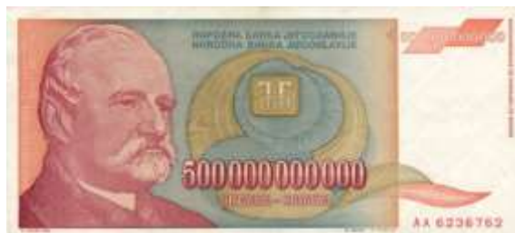
Fig.6. Iugoslavia, 1993. Bancnotă de 500 miliarde de dinari iugoslavi.

Cea mai puternică creștere a inflației în acea perioadă a avut loc din octombrie 1993 până la 24 ianuarie 1994, când prețurile au crescut cu 314 milioane % doar într-o lună, echivalentul a 64,6% pe zi, adică prețurile s-au dublat la fiecare 34 de ore, fiind a doua cea mai mare și cea mai lungă din istoria omenirii. Pe întreaga perioadă a inflației, prețurile au crescut cu aproximativ 5 cvadrilioane %.