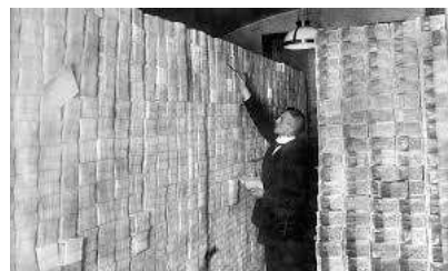
Fig.5. Un bancher din Berlin numără stive cu sume mari de mărci.