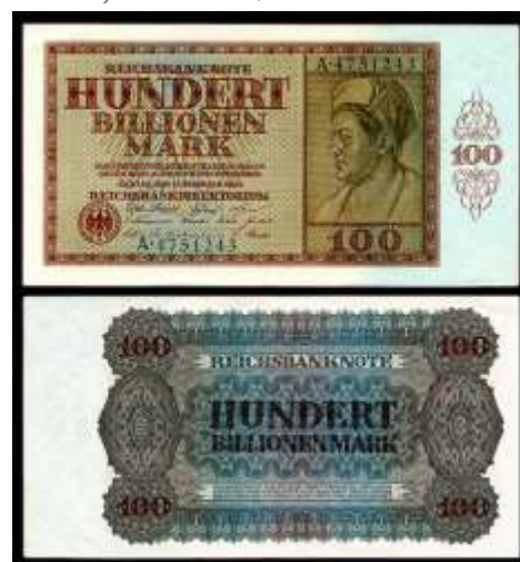
Fig.3. Bancnota cu cel mai mare nominal – 100 trilioane de mărci, emisă de Germania în februarie 1924.

Din iulie 1922 până în iulie 1923 rata inflației a crescut brusc, în urma căreia volumul de bani a crescut de 90 de ori, nivelul prețurilor – de 180 de ori, iar dolarul s-a scumpit de 230 de ori. În perioada iulie-noiembrie 1923 inflația în Germania a atins cifre astronomice: volumul ofertei de bani a crescut de 132 mii de ori, iar prețurile – de 854 mii de ori, dolarul s-a scumpit de peste 400 mii de ori. Astfel, în perioada cea mai cruntă inflația lunară în Germania a fost de 3,25 miliarde %; drept urmare, prețurile se dublau aproape la fiecare 49 de ore. Suma de bani aflată în circulație la sfârșitul anului 1923 – începutul anului 1924 era, conform Reichsbank, de 500 cvintilioane de mărci, valoarea reală a acestora fiind de 150 milioane de mărci în aur. La câteva săptămâni se tipăreau bancnote cu valori nominale tot mai mari, iar nominalul celei mai mari bancnote emise era de 100 trilioane de mărci.