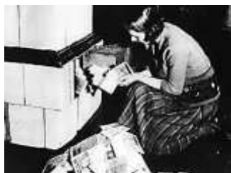
Fig.4. O femeie germană folosește bancnotele pe post de lemne.

Particularitatea oricărei hiperinflații constă în faptul că valoarea nominală a banilor este adesea mai mică decât valoarea lor ca material de hârtie. Astfel, sobele erau încălzite cu mărci germane, deoarece era mai ieftin decât cumpărarea lemnului de foc. Bancnotele erau folosite și pe post de tapete pentru încălzirea pereților. Copiii construiau piramide din pachete de bancnote, ca din cuburi etc. Cetățenii au încetat să mai tranzacționeze în numerar, în favoarea schimbului de bunuri. Mulți medici insistau să fie plătiți în cârnați, ouă, cărbune și alte produse similare. Oamenii schimbau o pereche de pantofi, o cămașă și veselă pentru cafea. Lumea trăia de pe o zi pe alta, ca și cum ar fi fost ultima. La teatru, cinema, circ, vizitatorii erau rugați să aducă mâncare în loc de bani (de ex., la teatru prețul locurilor ieftine costa 2 ouă, iar biletele pentru locurile mai scumpe erau estimate la un kilogram de unt; casa de bilete pentru circ anunța că se pot cumpăra bilete cu pâine, cârnați și fructe).