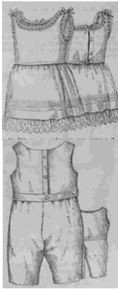
Figura 1. Lenjerie de corp [2]

Încă o caracteristică a vestimentației pentru copii ar fi că același interval de timp este dominat de forme vestimentare de diverse tipuri de siluetă cu menținerea volumului forme. Silueta trapez se caracterizează prin rochii cu linia taliei ridicată la nivelul liniei bustului, cu platcă sau fără acestea (fig. 2, a). Silueta X (fig. 2, b) se formează prin accentuarea taliei cu brăie de diferită lățime confecționate din materiale de garnisire. Silueta dreaptă (fig. 2, c) se întâlnește la rochii în stilul marinăresc cu talia coborâtă, care este foarte popular în această perioadă, lansat în vestimentație după unele surse [3] de pictorița Elizabet-Luiz Vije Lebrun. Generalizând am putea menționa că siluetele trapez, clepsidră și dreaptă se realizează în mare parte prin ridicarea sau coborârea liniei taliei indiferent de vârsta copilului.