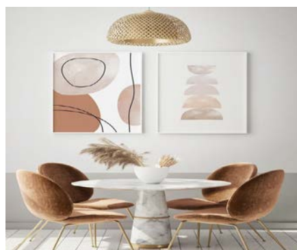
Fig.1 reprezentarea simetriei in interior

1.2. Punct focal accent. Accentul într-o încăpere este obiectul sau o zona la care se concentreaza privirea atunci cind vezi designul. Fara de acest lucru proiectele designerilor nu vor avea acea individualitate si farmec care-i pot autodifini. Pentru a crea o estetica deosebită într-un interior amenajat armonios putem utiliza accente care pot fi de mai multe tipuri: