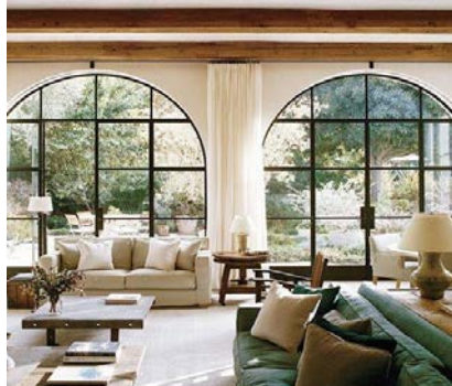
Fig.2 Reprezentarea punctelor focale/accentelor in interior

1.3. Ritm. Datorită ritmului designerul de interior creează conexiunea între diferitele elemente, prin folosirea culorilor, liniilor, formelor sau a texturilor, cu scopul de a crea interes vizual sau o continuitate. Scopul ritmului este să păstreze estetica vizuală a elementelor utilizate în amenajarea interioară.