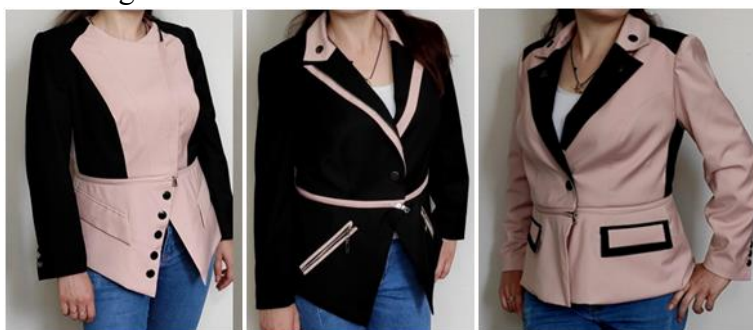
Figura 2. Modele proiectate prin procedee de transformare structurală. Modelul 1, 2 și 3

Modelele de jachete proiectate cu utilizarea procedeelelor menționate de transformare structurală sunt prezentate în Fig. 2.