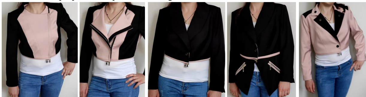
Figura 3. Transformări proprii ale produselor

Rezultatul obținut în procesul de diversificare a aspectului exterior al jachetelor din contul transformărilor proprii este reprezentat în Fig. 3.