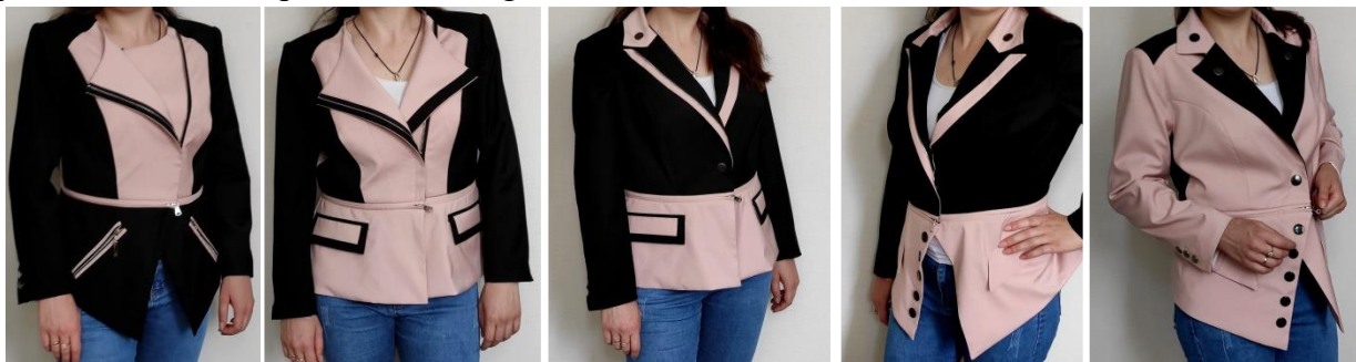
Figura 4. Transformări obținute în procesul permutării reperelor între modelele 1, 2 și 3

Numărul de transformări posibile în cadrul sistemului de modele elaborat depinde atât de transformările proprii ale produsului cât și de transformările efectuate în urma schimbului dintre produse care sunt reprezentate în Fig. 4.