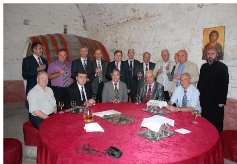
În crama de la Mănăstirea „Cetățuia” din Iași, sărbătorindu-l pe Academicianul Eugeniu Grebenicov, după primirea titlului de D.H.C., 8 septembrie 2011.