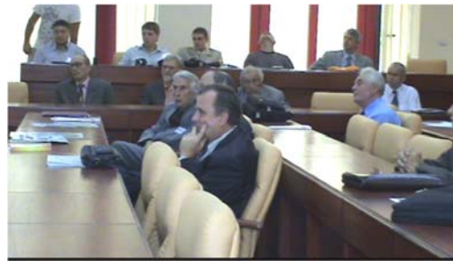
La Simpozionul CUCUTENI 5000 REDIVIVUS, ediția a IV-a, în Sala de conferințe a Facultății de Electrotehnică, 17 septembrie 2009.