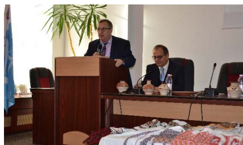
La deschiderea Simpozionului CUCUTENI 5000, ediția a XII-a, la Iași, 19 octombrie 2017

Avea o dragoste profundă față de istoria zbuciumată a neamului românesc, cunoștea în detaliu evenimente istorice ca nimeni altul și a ținut ca în luna august a anului 2017, când se împlineau 100 de ani de la eroicele lupte de la Mărășești, Mărăști, Oituz, să depună o jerbă de flori la Mausoleul de la Mărășești. Mergea des în satul natal să-și vadă mama, să discute cu oamenii din sat, să-i ajute. Această legătură strânsă cu locul de naștere i-a fost răsplătită cu onorabilul titlu de Cetățean de Onoare al Comunei Tupilați.