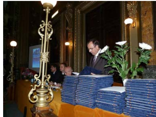
La festivitatea de sărbătorire a 60 de ani de la înființarea Facultății de Mecanică, în Aula „Gheorghe Asachi” a universității, 28 noiembrie 2008.