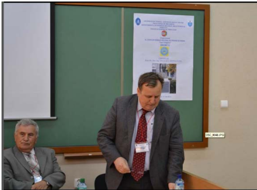
La deschiderea Seminarului Național de Organe de mașini în amfiteatrul care-i poartă numele, la Facultatea de Mecanică, 30 mai 2013.