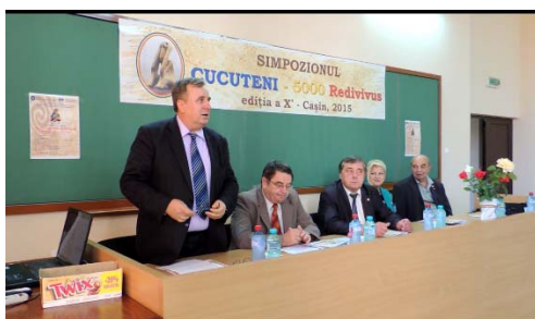
La deschiderea Simpozionului CUCUTENI 5000 REDIVIVUS, ediția a X-a, la Facultatea de Mecanică din Iași, în actualul amfiteatru „Cezar Opreșan”, 17 septembrie 2015.