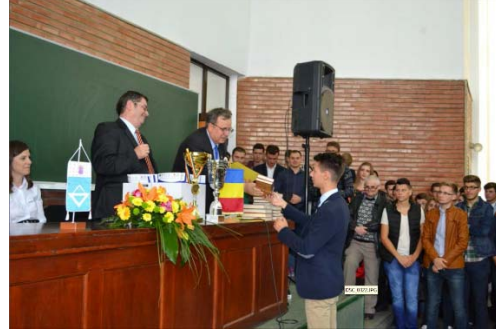
Înmânând premii studenților la deschiderea festivă a anului universitar 2015-2016, în amfiteatrul „Dimitrie Mangeron” al Facultății de Mecanică, 1 octombrie 2015.